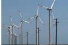
Излъгани надежди Lev.bg